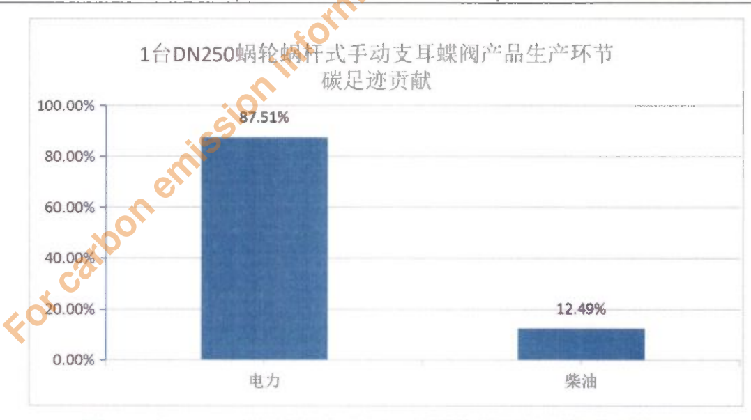
图 3 1台 DN250 蜗轮蜗杆式手动支耳蝶阀生产环节的碳足迹分析